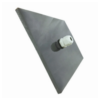
Герметичный кабельный ввод